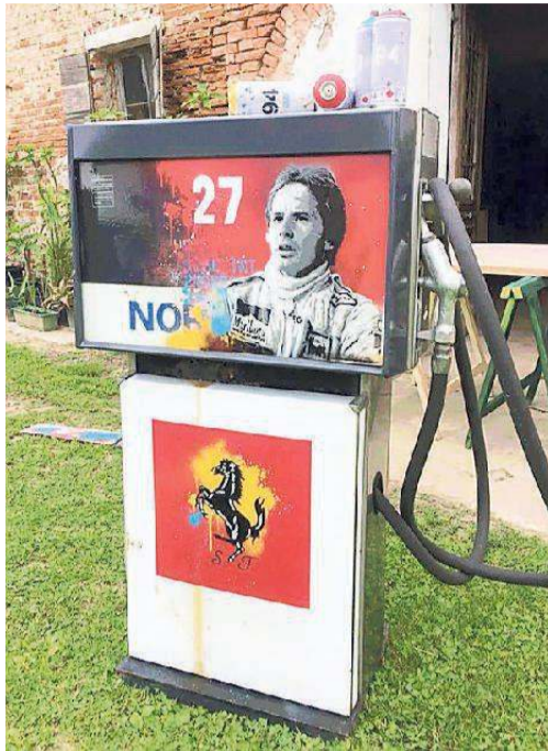
Alcune delle realizzazioni di Alessio-B. fra murales e altre opere disseminate per la città dal noto artista